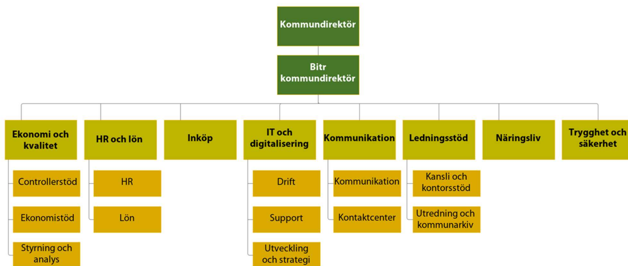
Figur. Kommunledningsförvaltningens organisationsschema

Dessutom har kommunstyrelsen ett särskilt ansvar för kommunens ekonomi och kvalitet, HR och lön, inköp, IT och digitalisering, kommunikation, ledningsstöd, näringsliv, besöksnäring och evenemang, trygghet och säkerhet samt plan, mark och exploateringsfrågor. Kommunstyrelsens uppgifter omhändertas av kommunledningsförvaltningen samt samhällsbyggnadsförvaltningens planavdelning och mark- och exploateringsavdelning.