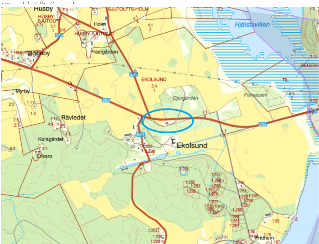
Planområdets läge i Enköping.