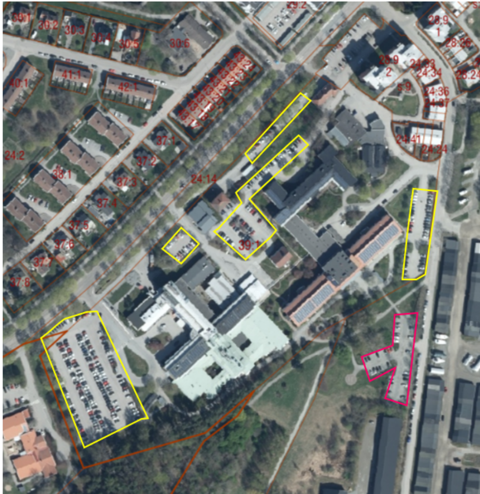
Parkeringsytor inom lasarettområdet markerade med gul polygon. Parkering inom kommunal mark som delvis nyttjas av lasarettet markerad med rosa polygon.