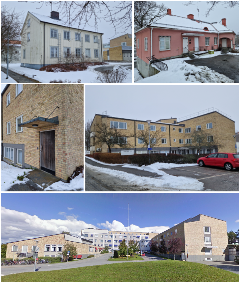
Byggnader inom sjukhusområdet.

Lasarettområdet ligger på åsen och därmed lite högre än omgivande gator. I norr angränsar området direkt mot bostäder i form av radhus och punkthus upp till 8 våningar. I söder och väster gränsar området mot småhusområden i 1–2 våningar. Sydöst om området ligger Enköpings småbåtshamn vars bebyggelse består av byggnader för båtförvaring.