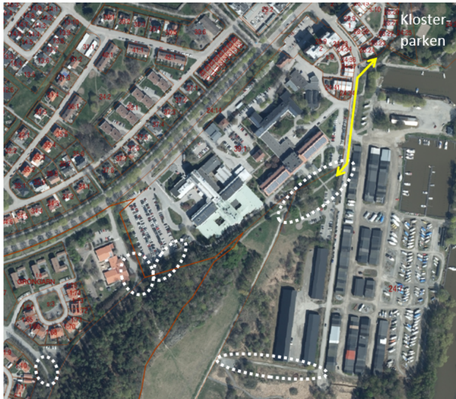
Huvudentréerna till Gröngarnsområdet markerade med vita ovaler. Den gula pilen illustrerar kopplingen mellan Gröngarn-Dyarna och närbelägna Klosterparken.

Inom Munksundet 39:1 södra del, i anslutning till Gröngarnsåsen, finns en skogbeklädd bård som upplevs utgöra en del av naturområdet och entrén till detsamma. Denna del har skyddats av prickmark i gällande detaljplan.