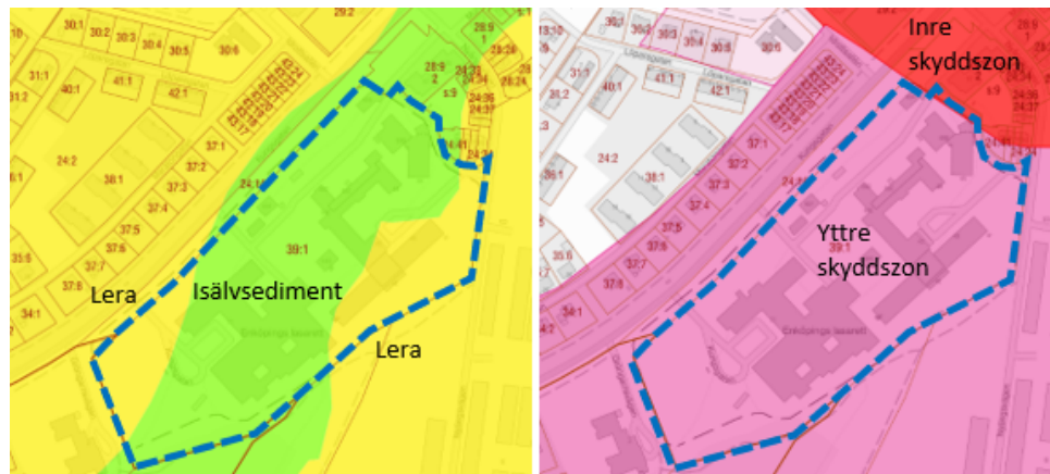
Till vänster utdrag ur jordartskartan (SGU). Till höger Vattenskyddsområdets utbredning. Sjukhusfastigheten markerad med blå streckad linje.

Området gränsar till Gröngarnsåsens naturområde som tillsammans med intilliggande Dyarna utgör ett av stadens viktigaste och mest uppskattade friluftsområden. Gröngarnsåsen-Dyarna har betydelse både utifrån sina naturvärden men också, inte minst, som friluftsområde. Kommunen har i den fördjupade översiktsplanen pekat ut området som ett önskvärt naturreservat. Området har också ett värde för sjukhusets verksamhet, som rekreativ miljö för personal samt för patienter och besökande. Kommunen har bland annat därför arbetat med tillgänglighetsanpassning i området för att öka tillgängligheten för alla grupper.