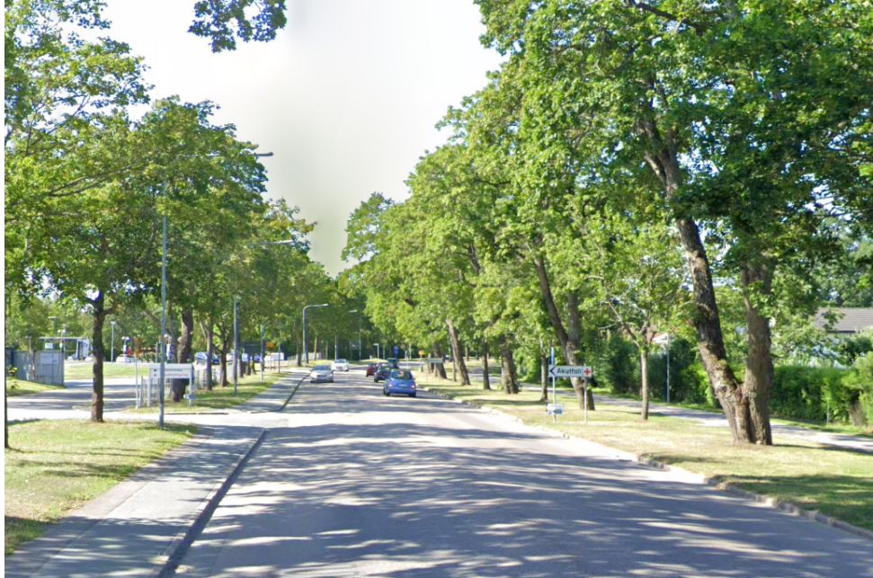
Kungsgatan sedd söderut, strax norr om infarten till akutmottagningen.

Kungsgatan är allékantad och har en bredd om cirka 11,5 meter inklusive trottoar på den sydöstra sidan. På dess norra sida löper en gång- och cykelväg som är avdelad från vägen av gräsremsa med alléträd. Allén längs Kungsgatan som ligger utanför sjukhusets fastighet (Munksundet 39:1) omfattas av generellt biotopskydd.