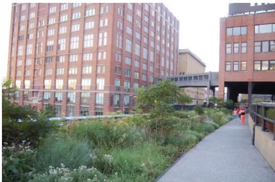
Del av High Line, New York.