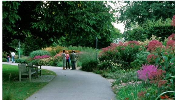
Drömparken en sensommardag.