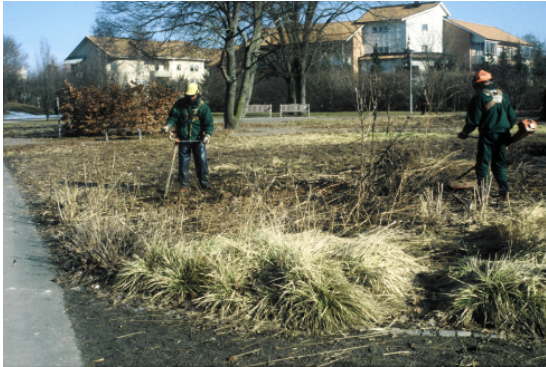
Perennerna trimmas ned under tidig vår.

Perennerna är valda för att klara sig utan stöd men här finns det undantag som till exempel blodtopp, vissa kransveronikor och högre salvior. Stöden sätts under växtsäsongen innan perennerna blivit allt för höga.