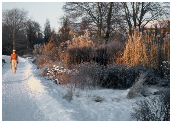
Drömparken en vinterdag.