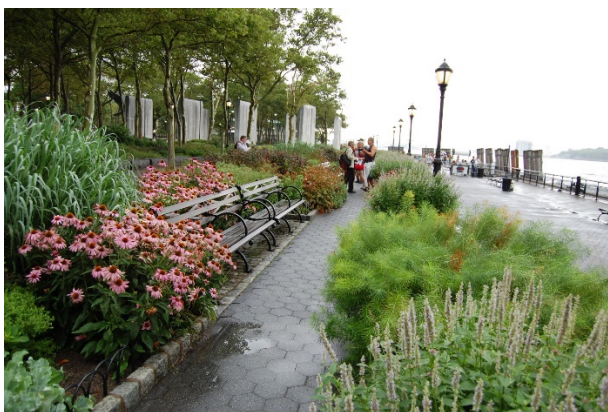
Del av Battery Park, New York.