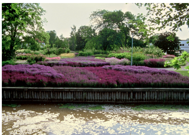
Salviafloden som rinner ner mot Enköpingsån. Notera den livfulla rörelsen genom blommornas variationer i färg och form.

Kombinationen av perenner och olika prydnadsgräs, ger planteringarna ett naturpräglat utseende. Träden är viktiga i strukturen då de till viss del styr utformning och val av växter. I Parkens västra del finns en stor salviaplantering med tre sorters salvior i olika blå toner som likt en flod rinner ner mot den närläggna Enköpingsån. Denna del av parken kallas för Salviafloden.