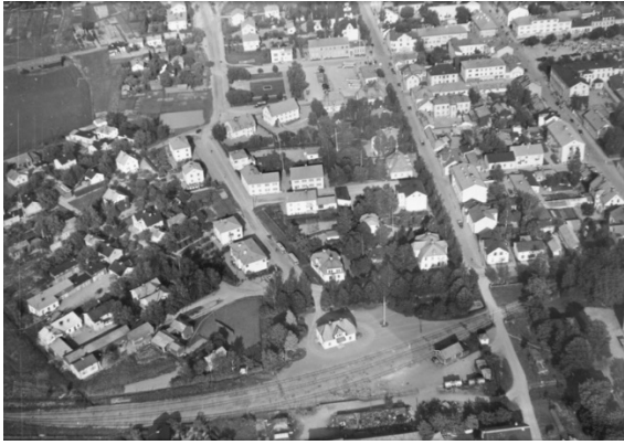
Stationsområdet med stationshuset från 1906. Järnvägen trafikerades till 1976.