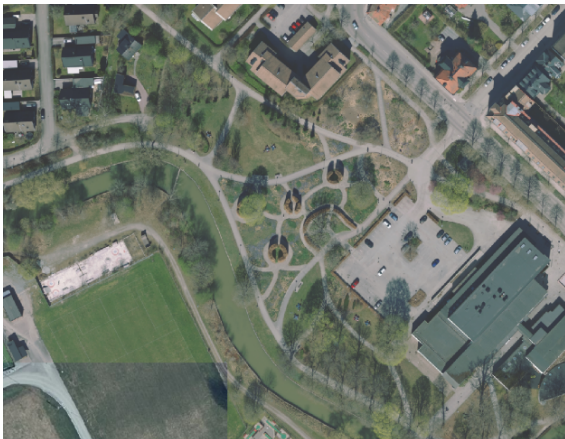
Drömparken i dag. I den gamla järnvägens sträckning går i dag en gång- och cykelväg fram.