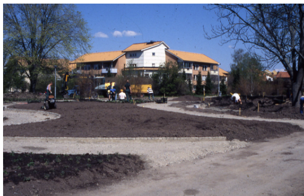
Drömparken under anläggning våren 1996.