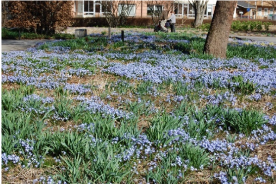
Vår i Drömparken.