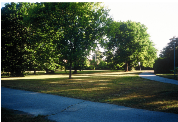
Den del som senare skulle bli Drömparken utgjordes av ett större parkområde, Strömparterren utmed Enköpingsån. Foto: Stefan Mattson 1995