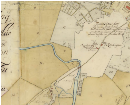
Geometrisk karta 1736. Norr om och mellan Enköpingsåns båda krökar finns det område som i dag utgörs av Drömparken. På 1700-talet var området en del av stadens ängsmarker.

Parken ligger mellan Enköpingsån och den äldre stadskärnan. En karta från 1730-talet visar att området då utgjordes av ängsmarker tillhörande staden. Efter en omfattande stadsbrand 1799 erhöll staden, till skillnad mot den medeltida stadsplanen, en mer strikt rutnätsplan. Området där Drömparken i dag ligger kom under början av 1900-talet att delvis tas i anspråk av nya järnvägen Enköpings hamn – Enköpings järnväg och ett nytt stationshus invigdes på platsen 1906. Järnvägen trafikerades till och med 1976, varefter spåret revs upp och stationshuset revs.