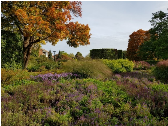
Drömparken i september.