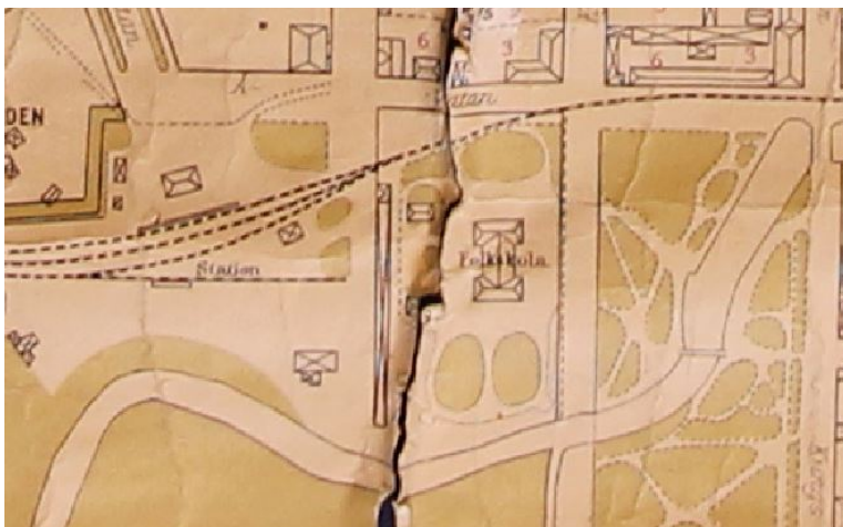
På kartan från 1914 ses stationsområdet och den angränsande skoltomten som tillkom på 1880-talet och som idag är parkering. Den långsmala byggnaden som ligger mellan stationsområdet och skoltomten var ett replageri. Öster om skoltomten ligger parken Strömparterren. Området mellan järnvägen och Enköpingsån utgör i dag Drömparken.