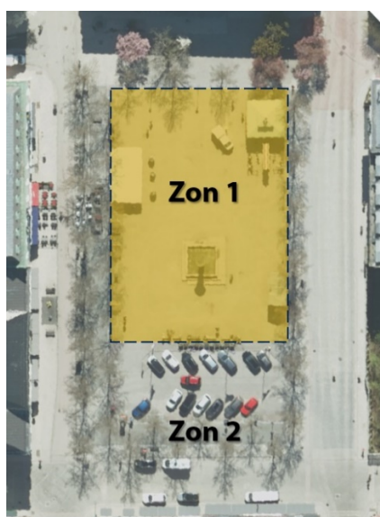
Bild 1. Zoner som gäller torghandel