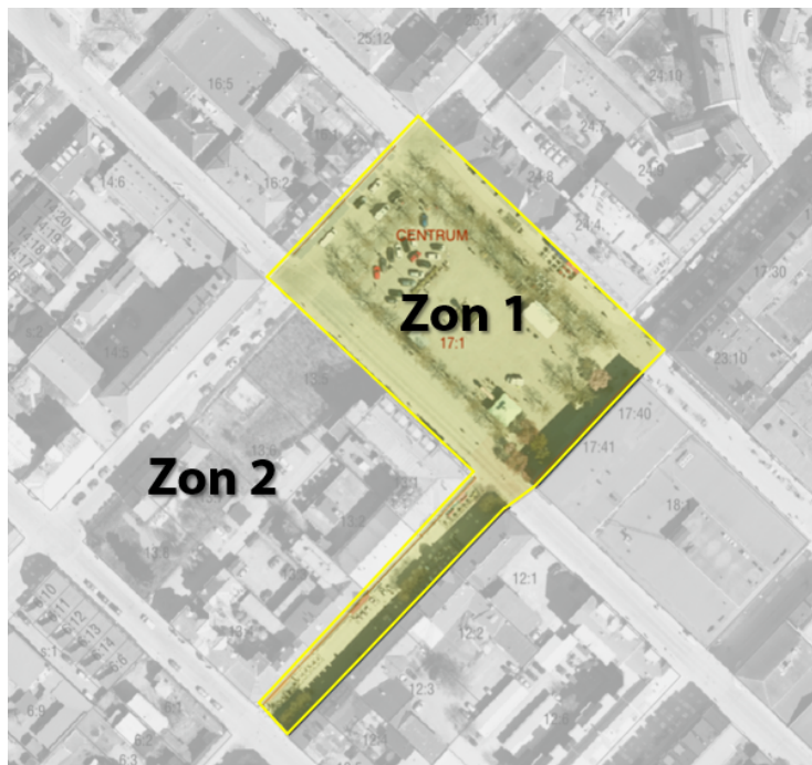
Bild 2. Zoner som gäller uteserveringar och varuexponering